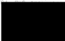
Lýdia Šuchová riaditeľka Agentúry na podporu výskumu a vývoja

AGENCIÁ NA PODPORU VÝSKUMU A VÝVOJA Mýtna 23, P.O. BOX 839 04 839 04 BRATISLAVA IČO: 307977