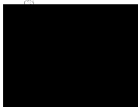
Lýdia Šuchová riaditeľka Agentúry na podporu výskumu a vývoja

AGENTÚRA NA PODPORU VÝSKUMU A VÝVOJA Mýtna 25, P.O. BOX 539 04 839 04 BRATISLAVA IČO: 30797764 OIČ: 2022132563