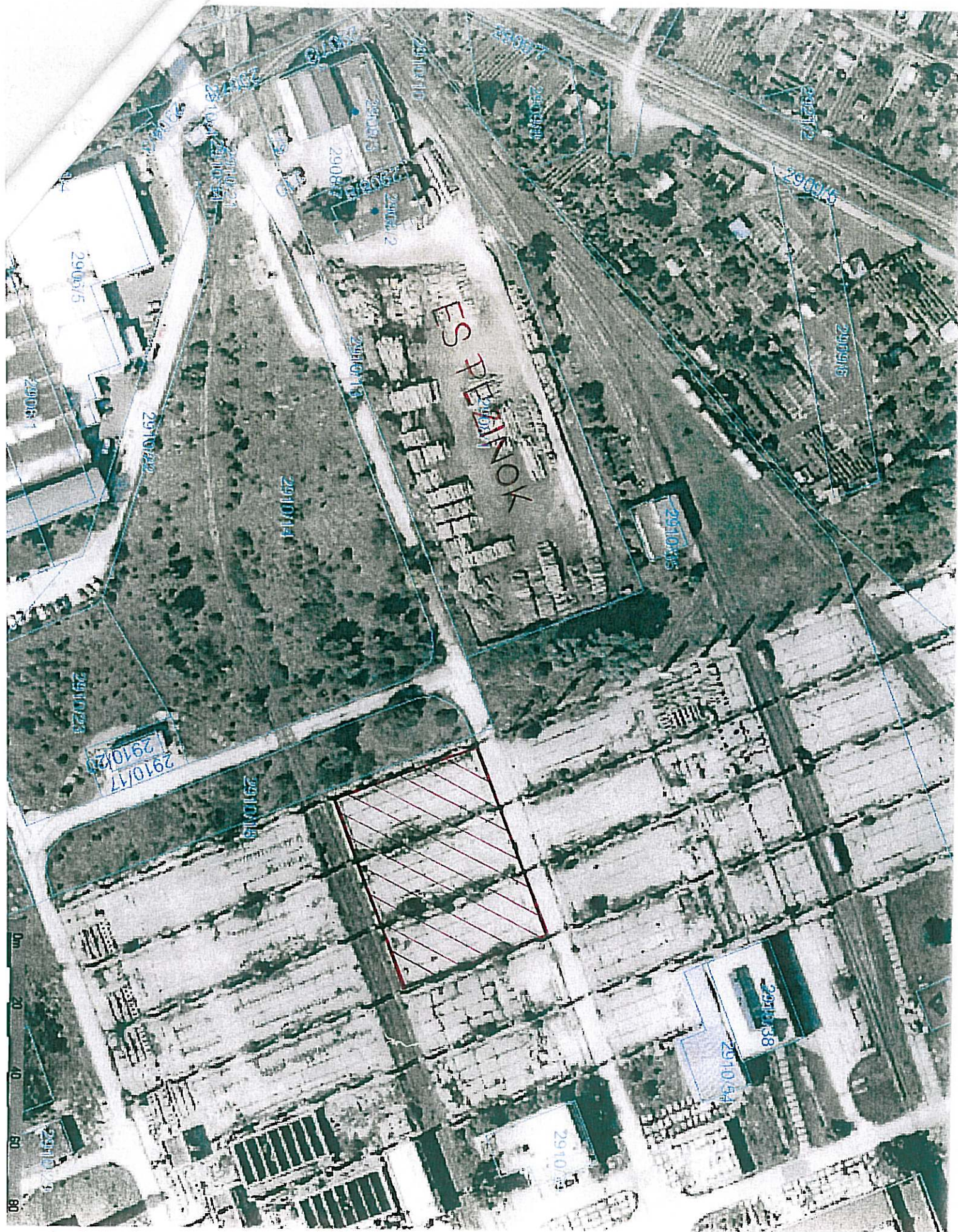
K.ú. Pezinok časť parcely C-KN č. 2910/1 podľa NZ č. 1532/2011/160