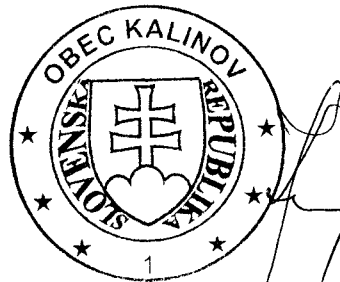
..... starosta obce