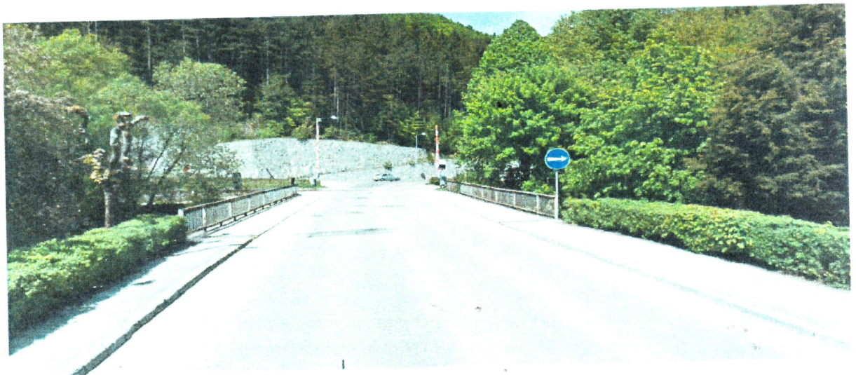
Smer od Rajeckých Teplic