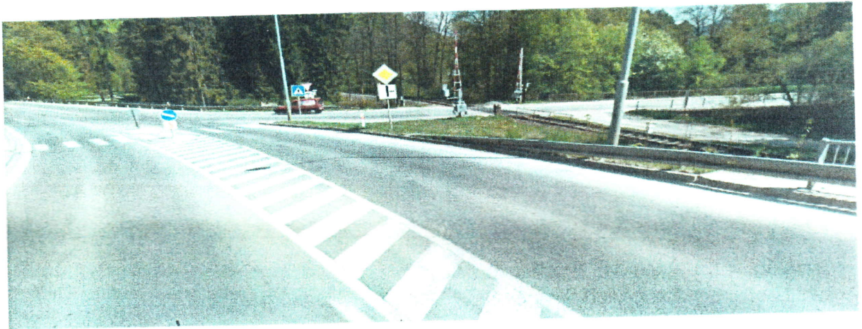
Smer od Rajca