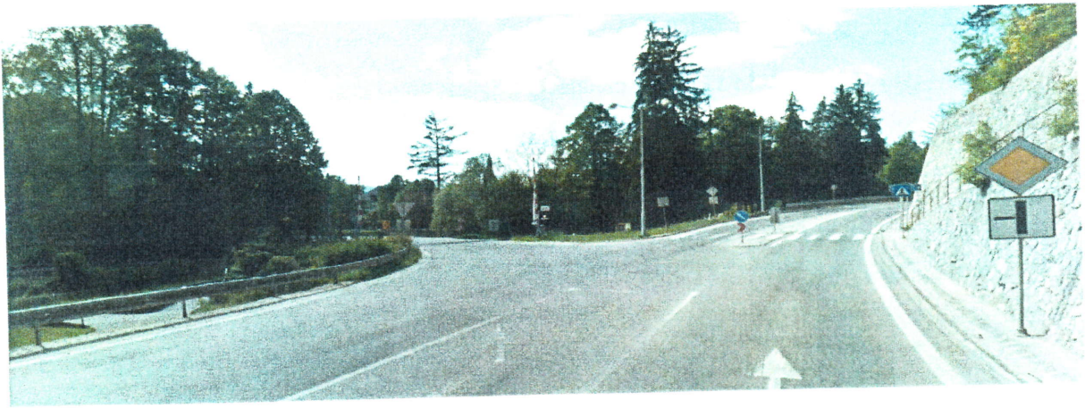
Smer od Žiliny