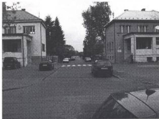
Obr. č. 1- č. 4 Monitorované územie pri základných školách na Jilemnického ulici