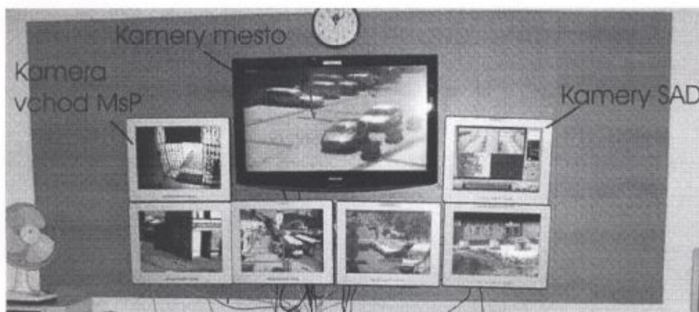
Obr. č. 5. Monitorovacie pracovisko MsP

V následnosti na tento projekt predpokladáme v budúcnosti postupnú inštaláciu ďalších kamier na miestach s vybudovanou optickou infraštruktúrou (sieť ZOMES). Postupujeme podľa pripravenej štúdie „Komplexný bezpečnostný kamerový systém MsP, Štúdia v.1.0“ a projektov na realizáciu kamerového systému pre Cintorín Zlatý Potok a kamerový systém pre židovský cintorín. Celkový počet v zmysle Štúdie v.1.0 z roku 2007 má dosiahnuť 33 kamier monitorujúcich verejne prístupné miesta, čo kladie nároky aj na zvýšený počet monitorov.