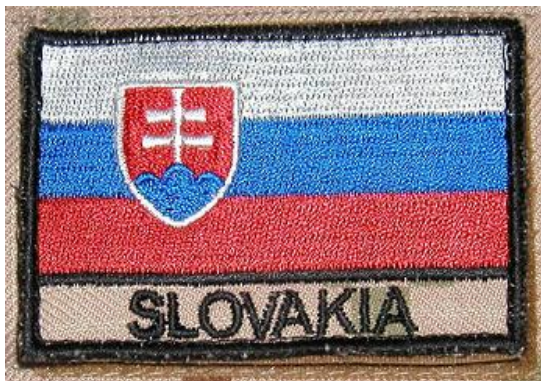
Obrázok č. 1

Všetky použité nite sú v matnom vyhotovení. Používané nite ISACORD :