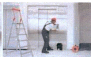
Servis 24 hodín