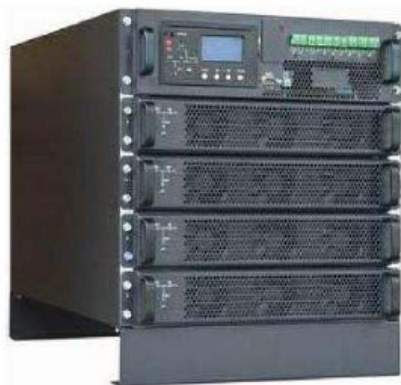
Ilustračný obrázok UPS: