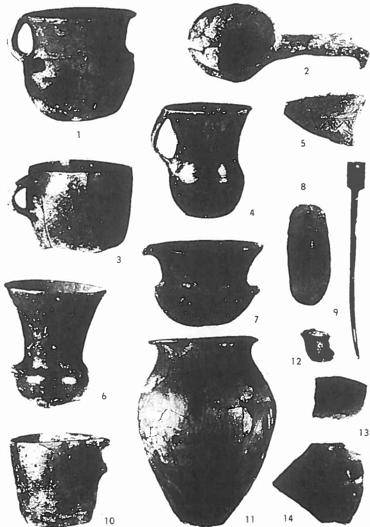
Obr. 6 Vrable-„Földvár“, 1-14 — mađarovská kultúra