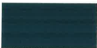
riaditeľ ľudských zdrojov Bratislavská teplárenská, a.s. na základe poverenia