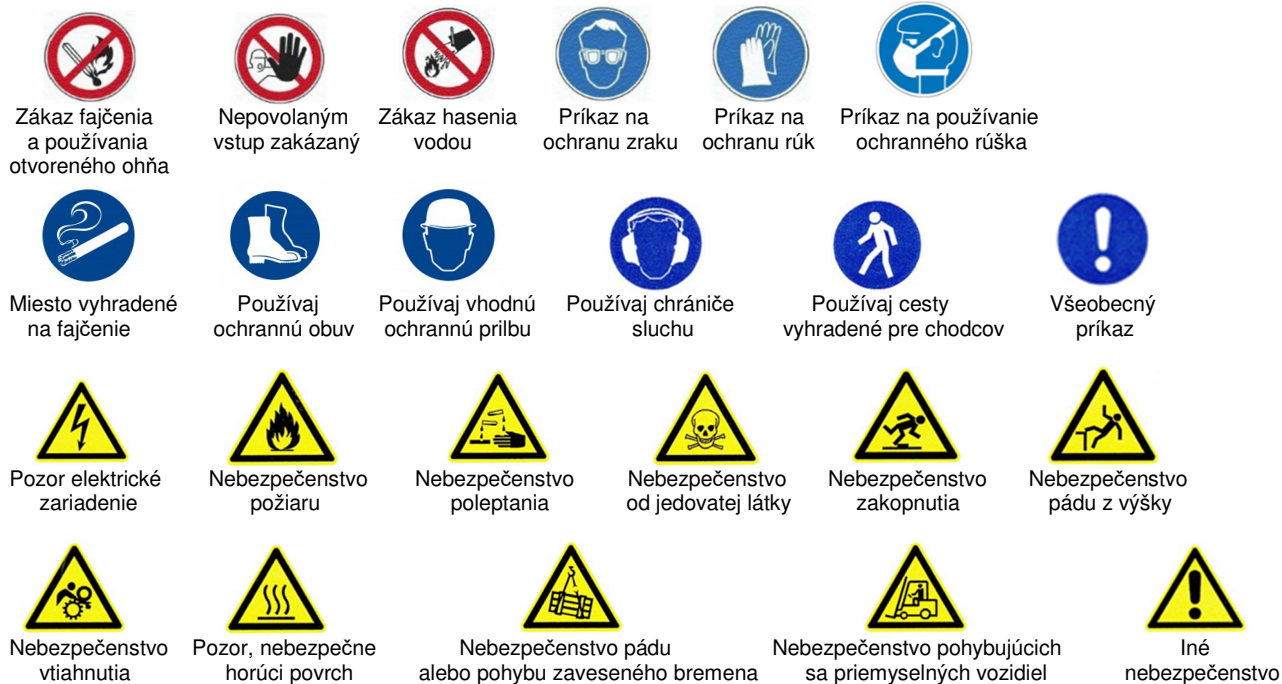
Zákaz fajčenia a používania otvoreného ohňa Nepovolaným vstup zakázaný Zákaz hasenia vodou Príkaz na ochranu zraku Príkaz na ochranu rúk Príkaz na používanie ochranného rúška Miesto vyhradené na fajčenie Používaj ochrannú obuv Používaj vhodnú ochrannú prilbu Používaj chrániče sluchu Používaj cesty vyhradené pre chodcov Všeobecný príkaz Pozor elektrické zariadenie Nebezpečenstvo požiaru Nebezpečenstvo poleptania Nebezpečenstvo od jedovatej látky Nebezpečenstvo zakopnutia Nebezpečenstvo pádu z výšky Nebezpečenstvo vŕtania Pozor, nebezpečne horúci povrch Nebezpečenstvo pádu alebo pohybu zaveseného bremena Nebezpečenstvo pohybujúcich sa priemyselných vozidiel Iné nebezpečenstvo

Ďalšie značenie v spoločnosti, ktoré si treba všímať a dodržiavať