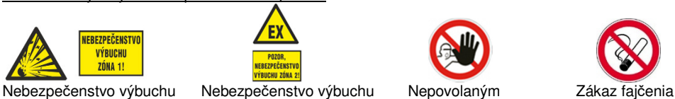
Nebezpečenstvo výbuchu Nebezpečenstvo výbuchu Nepovolaným Zákaz fajčenia

Miesta so zvýšeným nebezpečenstvom výbuchu