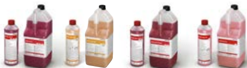
MAXX INTO2 MAXX INTO ALK2 MAXX INTO CITRUS2 MAXX INTO C2