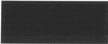
Milan Kirn na základe poverenia