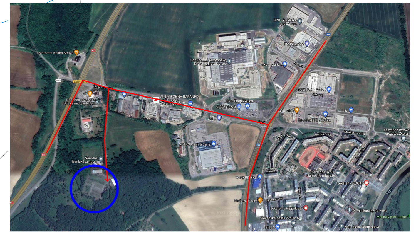
Dopravné trasy, situácia širších vzťahov