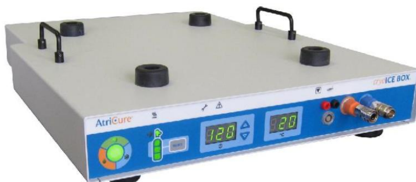
Cryo-konzola ACM2 V6