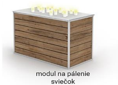
modul na pálenie sviečok

3 x svietidlo ku chodníku, ceste (stredne vysoké)