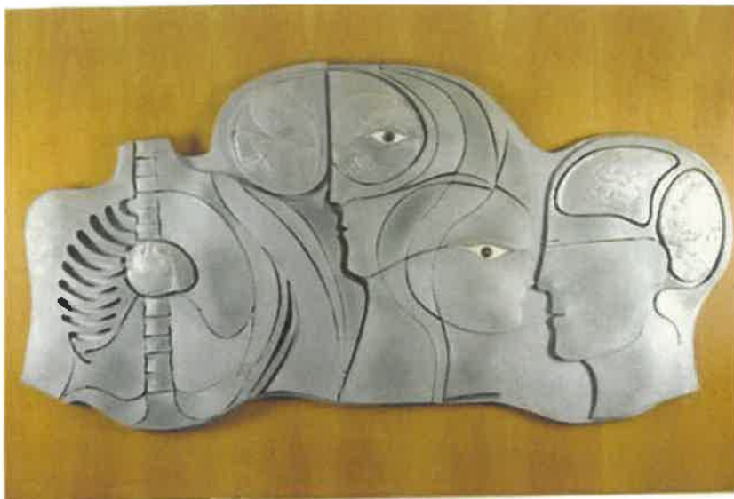
1983 Starostlivosť, reliéf pre kanceláriu riaditeľa DFN Kramáre, oceľ-hydrónárium, 70x180cm (fk, f)