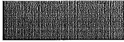
Igor Mesároš, štatutárny zástupca za predávajúceho