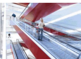
Eskalátory & pohyblivé chodníky