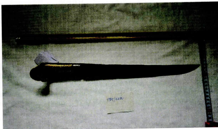
Chladná zbraň typu jatagan 1981/0212H, H2592