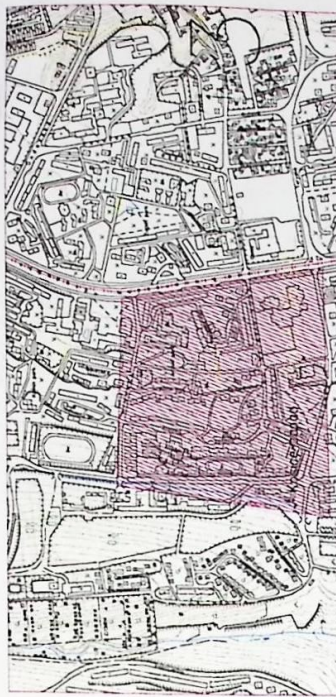
Celková situácia M 1:10000