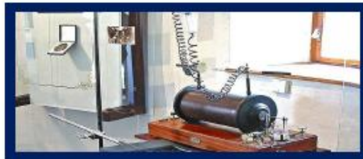
Prvý röntgenový prístroj na Slovensku(1897)

Ako prvý na Slovensku skúmal pomocou X lúčov tuberkulózu pľúc