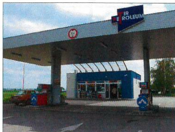
ČS TIR PETROLEUM, Koniarekova, Trnava