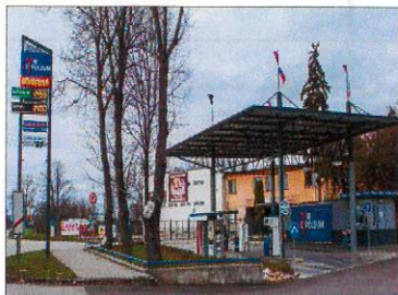
ČS TIR PETROLEUM, Suchovská, Trnava