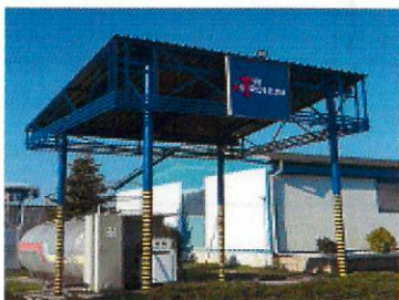
ČS TIR PETROLEUM, Nitrianska, Trnava