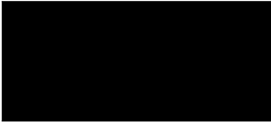
riaditeľka Mestské kultúrne centrum