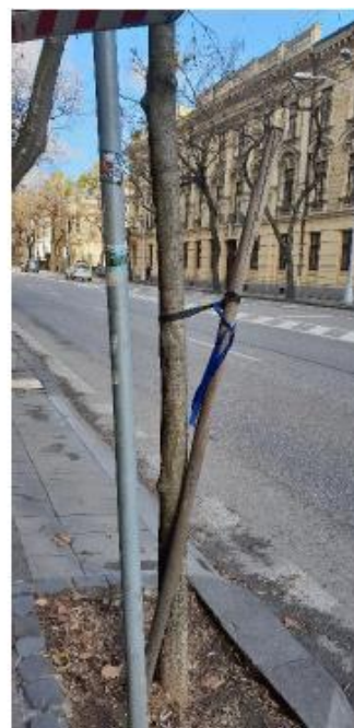
strom č. 26 – podchodná výška strom č. 28 – poškodený kmeň strom č.29 – nefunkčné kotvenie