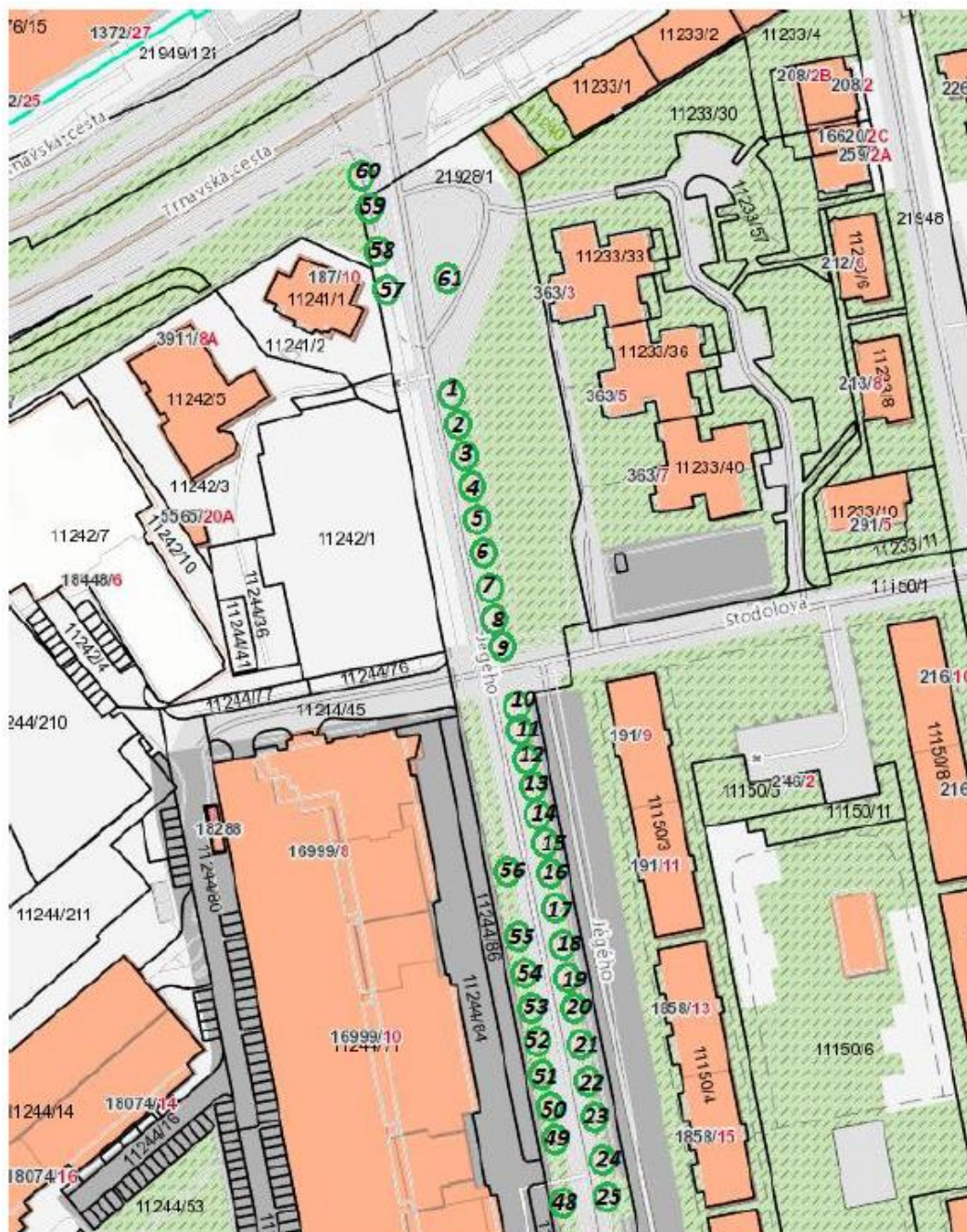
Situácia č. 1

V (Výrub – asanácia) – asanácia je navrhovaná pri stromoch s vážnym poškodením kmeňa, bázy kmeňa, suchej a odumierajúcej koruny, pri stromoch, kde nie je perspektíva zlepšenia ich celkového stavu a možného ponechania na mieste. – opatrenie nie je predmetom zákazky