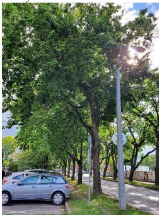
stromy č. 31 - 43