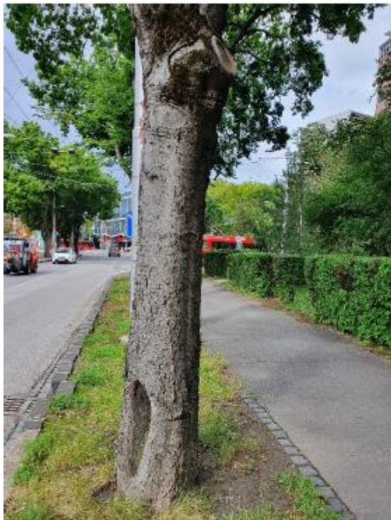
viacnásobne poškodený kmeň