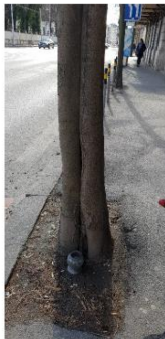
strom č. 19 – otvorená dutina strom č. 21 – kmeň zasahuje do strom č. 26 – poškodený kmeň v hl. rozkonárení jazdnej dráhy, poškodený odretím