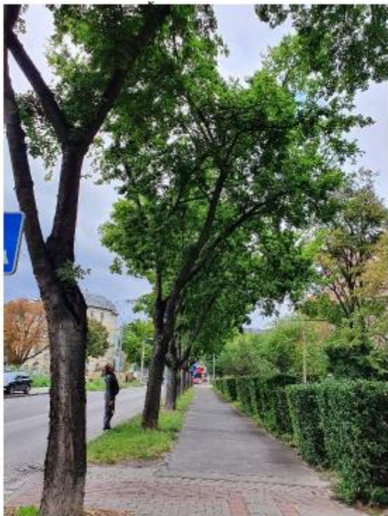
stromy č. 1 – 10