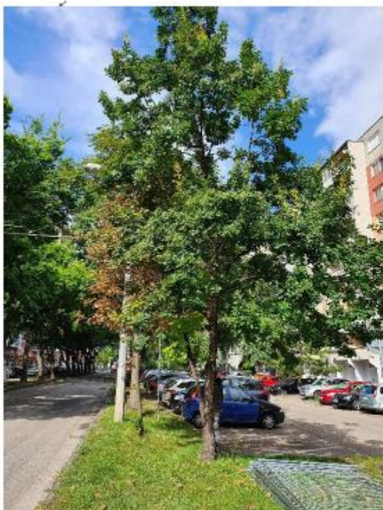
stromy č. 28 – 30