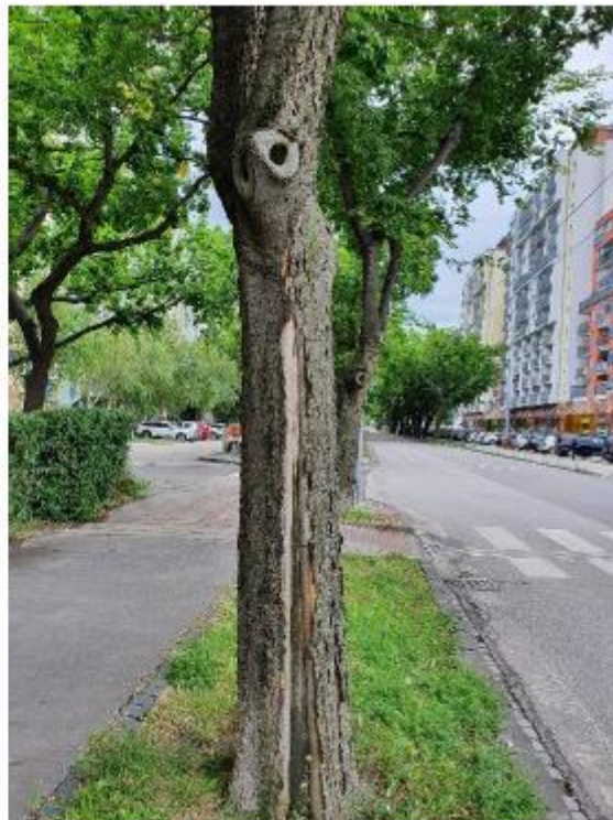
vážne poškodený kmeň