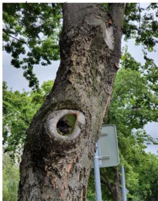
strom č. 12 vyhnívajúce rezné rany