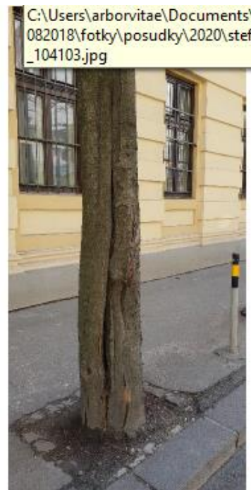
strom č. 7 – zdeformovaný chodník strom č. 15 – rana na kmeni strom č. 16 – vážne poškodený kmeň