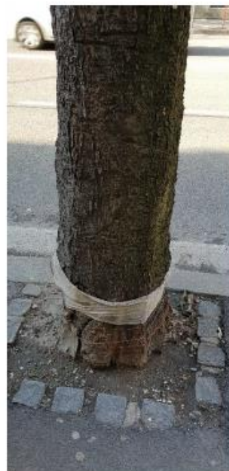
strom č. 1 strom č. 2 – odretý kostrový konár strom č. 4 – poškodená báza kmeňa