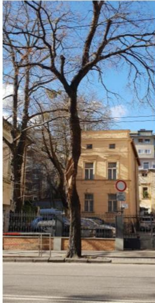
strom č. 50 – zasahuje do jazdnej dráhy, vážne poškodený kmeň oderom

Pre všetky uvedené činnosti platí STN 83 7010 „Ošetrovanie, udržiavanie a ochrana stromovej vegetácie“ Arboristický štandard – Rez stromov, ISBN 978-80-552-1364-4 ÖNORM L1122 Baumpflege und Baumkontrolle ZTV- Baumpflege 2017