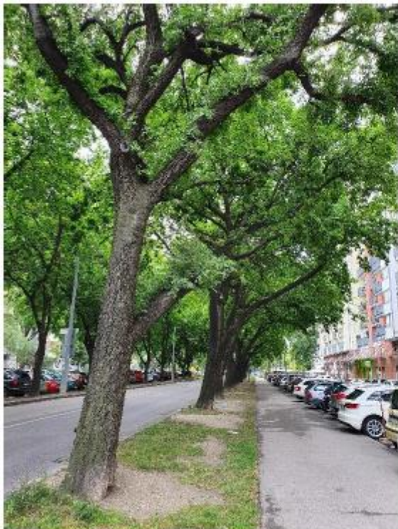
stromy č. 44 – 56 stromy č. 57 – 60