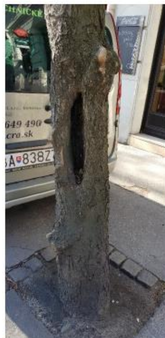
Strom č. 42 – poškodený kmeň strom č. 48 – zle realizovaný výchovný rez, poškodený kmeň