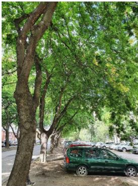
stromy č. 11 – 25