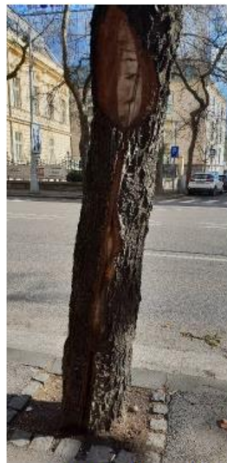
strom č. 31 -vážne poškodená kmeň strom č. 33 – otvorená dutina na kmeni strom č. 36 – vážne poškodený kmeň