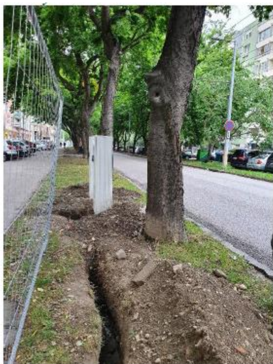
výkopy v tesnej blízkosti stromov