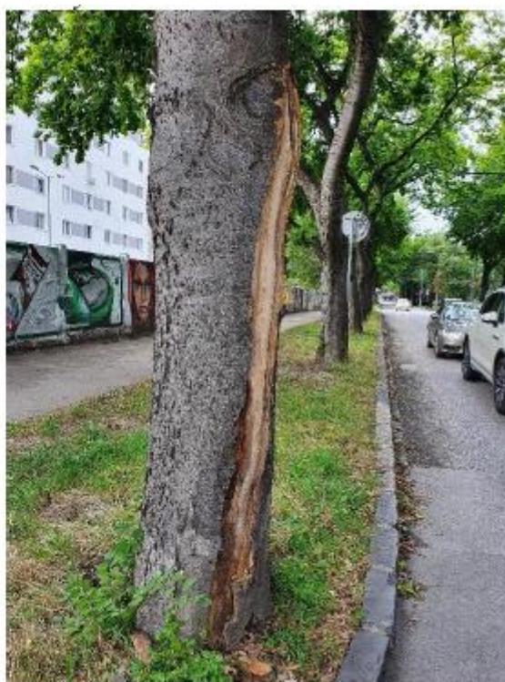
vážne poškodený kmeň strom č. 37