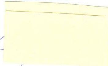
Radim Gerbél konateľ