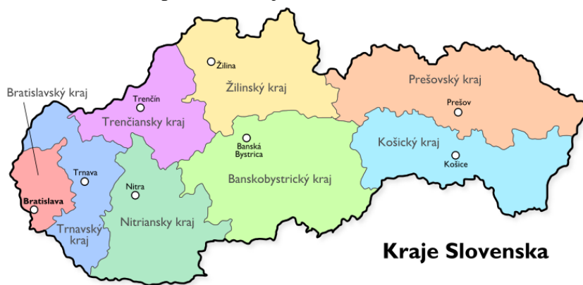
Obrázok č. 1: Mapa SR