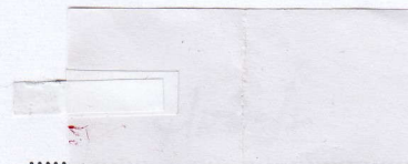
..... za odberateľa