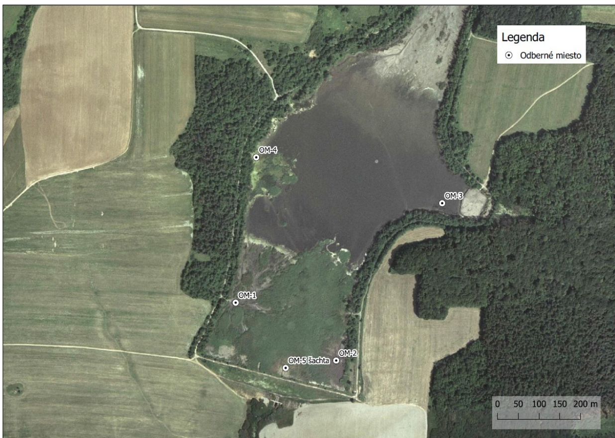
Obrázok č. 2 – Ortofotogrammetrický snímok s vyznačením miest odberov