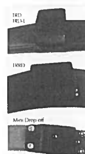
Rôzne modely rozpojky pre všetky typy obojkov

Ide o satelitný obojek, ktorý využíva satelity typu Iridium. Hmotnosť obojka je 250g, po inštalovaní rozpojky do 300g. Obojek je vybavený časovou rozpojkou. Životnosť batérií je min. 2 roky pri požadovanom spôsobe zberu súradníc každé 2 hodiny. Zber súradníc umožňujú získať 8760 súradníc z 1 obojka pri dvojročnom zbere. Zaznamenanie prvej súradnice nastane po dovŕšení celej hodiny po aktivácii obojka. Obojek je ďalej vybavený senzorom mortality a aktivity, snímačom teploty a virtuálnym plotom. Obojky majú VHF vysielateľ, pričom požadované frekvencie uvedené v špecifikácii je možné nastaviť individuálne pre každý obojek. Obojek je ďalej vybavený dvojsmernou komunikáciou, ktorá umožňuje sťahovanie údajov, ako aj upload (nahrať) režimu VHF a GPS údajov a tiež polygónov virtuálneho plota do obojka, pričom download aj upload sa uskutočňujú cez webové rozhranie, kde objednávateľovi bude poskytnuté prístupové heslo do osobnej administratívy odkiaľ si bude môcť požadované súradnice sťahovať. Súradnice o polohe zvieratá budú zasielané na server dodávateľa raz za 24 hodín. V prípade, že obojek je už zo zvieratá odpadnutý je možné realizovať download údajov z obojka do počítača pomocou PC interface. Obojek sa aktivuje magnetom.