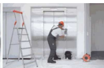
Servis 24 hodín