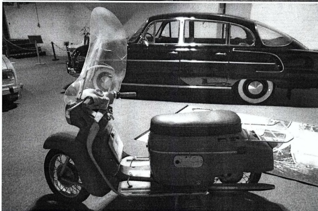
MANET S 100, skúter, rok 1959, červená farba