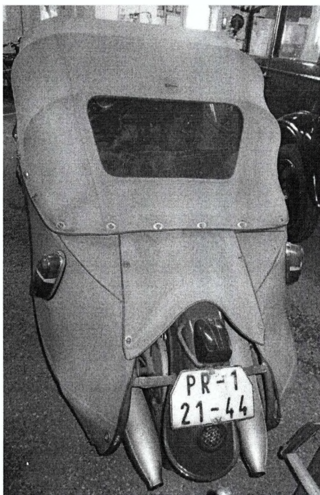
VELOREX 16/350, rok výroby 1968, zdvihový objem 344 cm 3 , výkon 16k, farba hnedá, plátno+ koženka