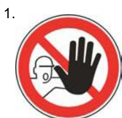
Nepovolaným vstup zakázaný (spolu so značkou č.2, 3 alebo 4 a príslušnou dodatkovou tabuľou)