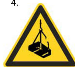
Nebezpečenstvo pádu alebo pohybu zaveseného bremena