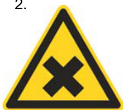
Nebezpečenstvo škodlivej alebo dráždivej látky