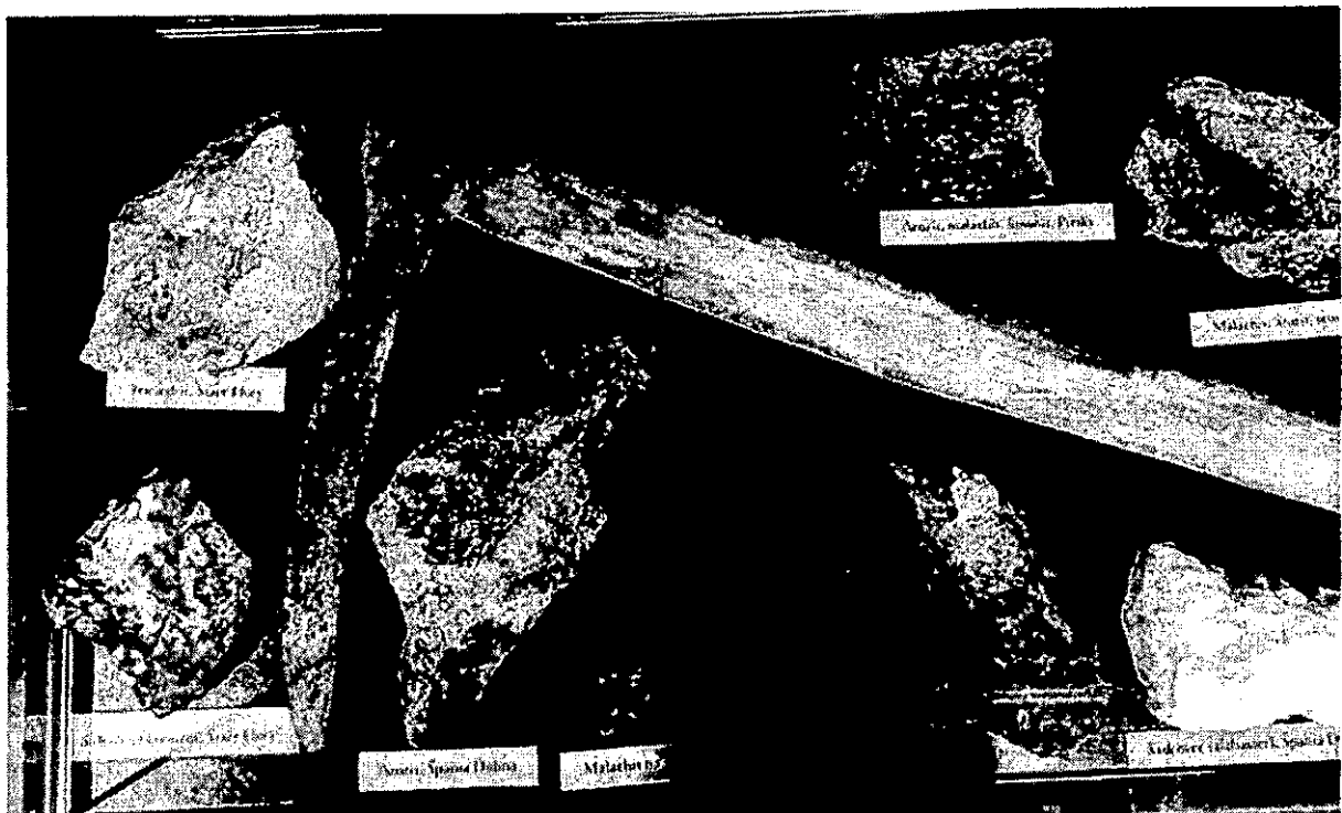
č. 2: Azurit, Malachit, Limonit – Piesky, č. 3: Malachit, Azurit, Tenorit, Limonit – Piesky, č. 4: Malachit – Piesky, č. 5: Tenorit, Azurit – Piesky.