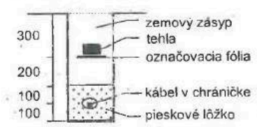
Výkop a uloženie kábla v zemi v reze