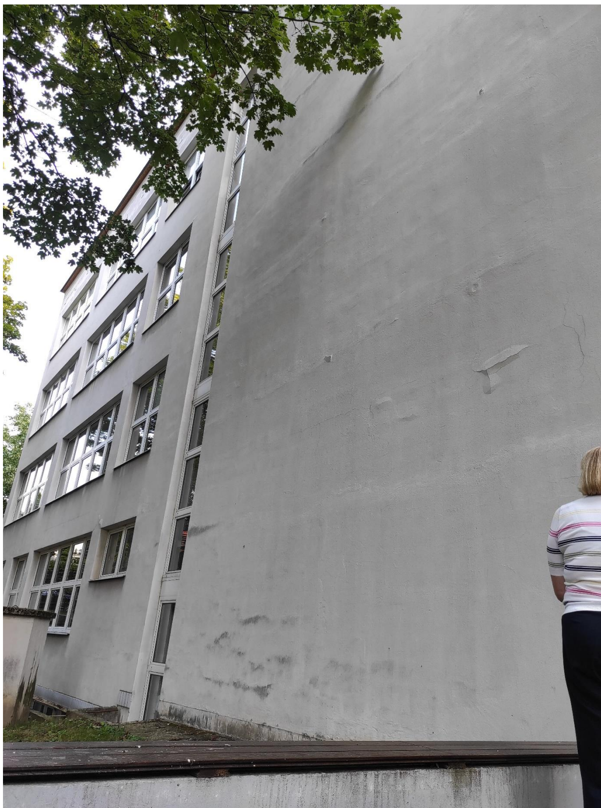
Navrhované miesto pre exteriérový výťah