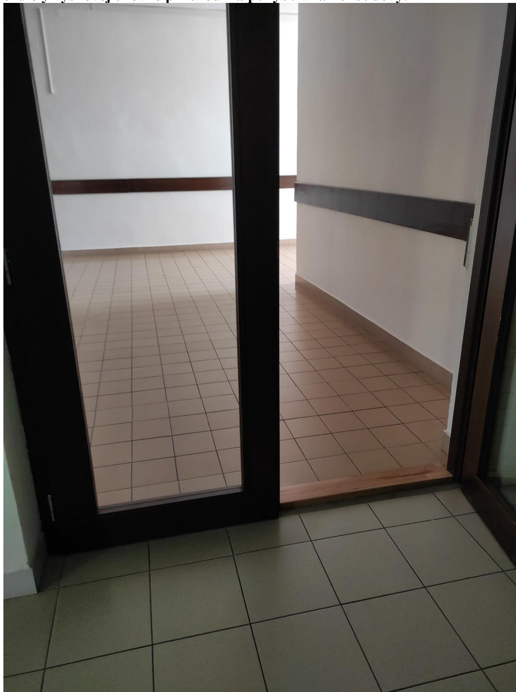
Prahy na podlažiach smerom od budúceho výťahu do chodieb s učebňami