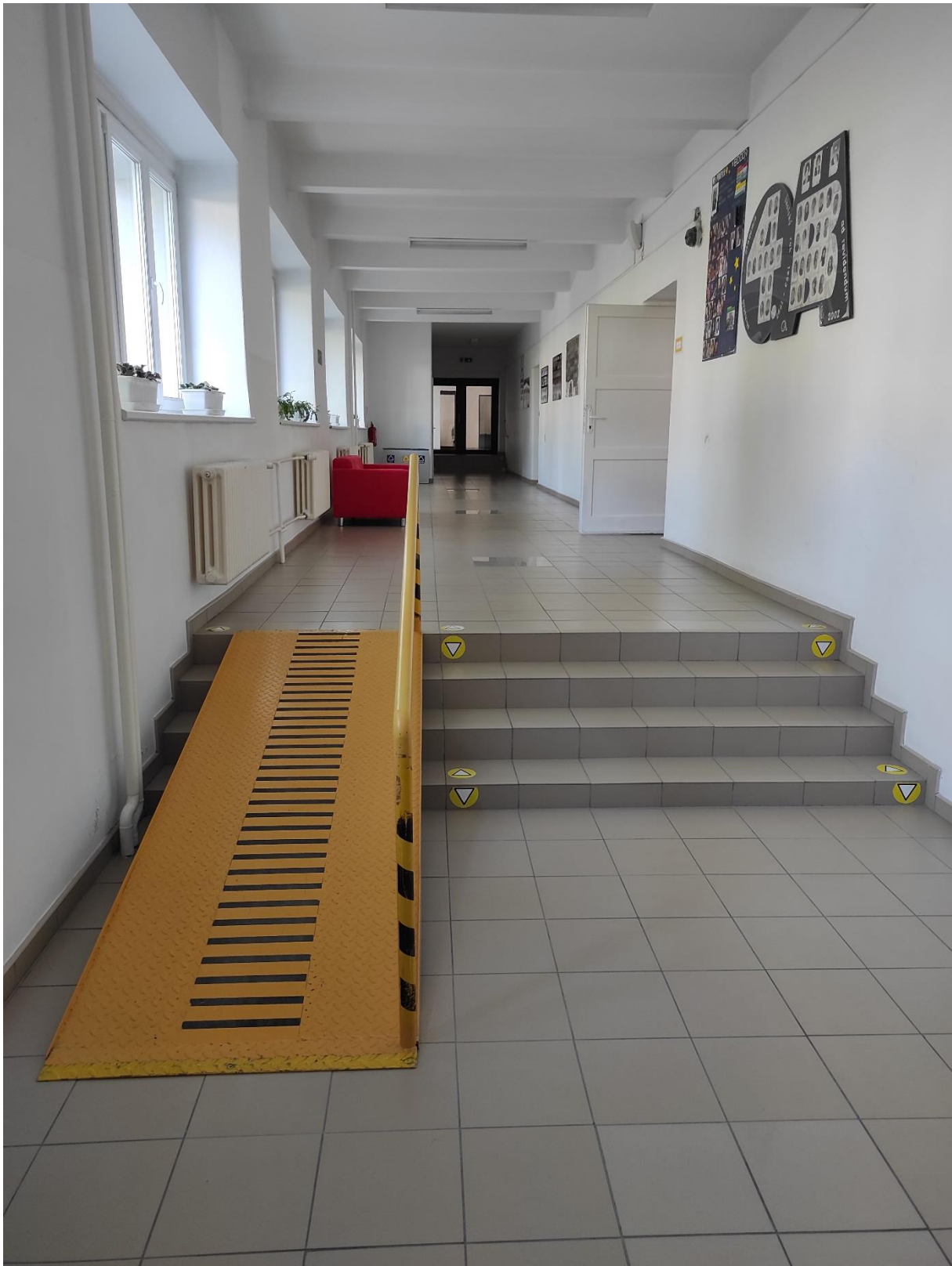
Trasa z vestibulu do chodby s učebňami, na ktorej sa nachádzajú v druhej časti 4 schody (nachádza sa na nich rampa, ktorá však nespĺňa požiadavky uvedené v Manuály debarierizácie škôl a školských zariadení).