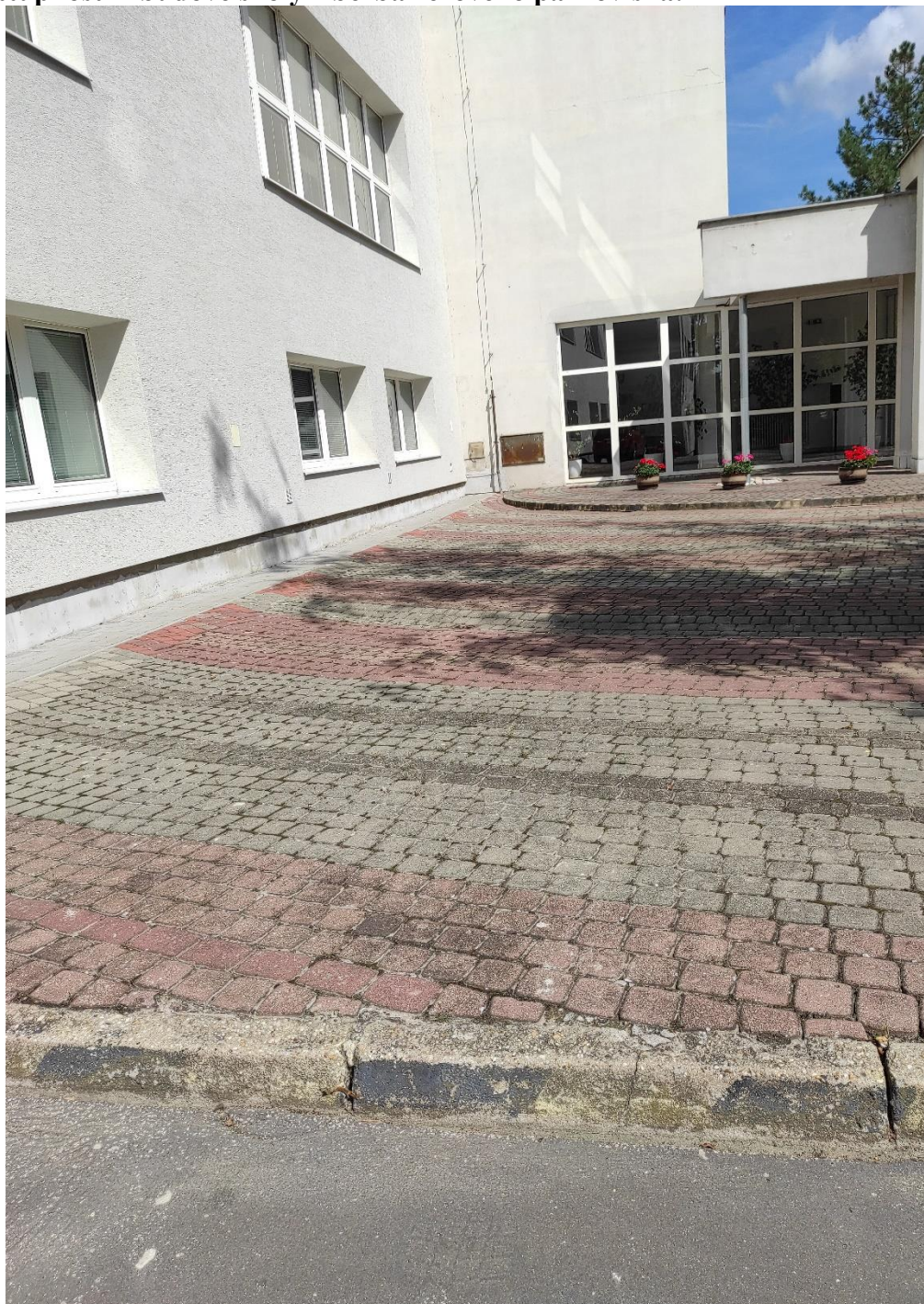
Miesto pre vyhradené parkovanie a bariéry pri vstupe do budovy z neho