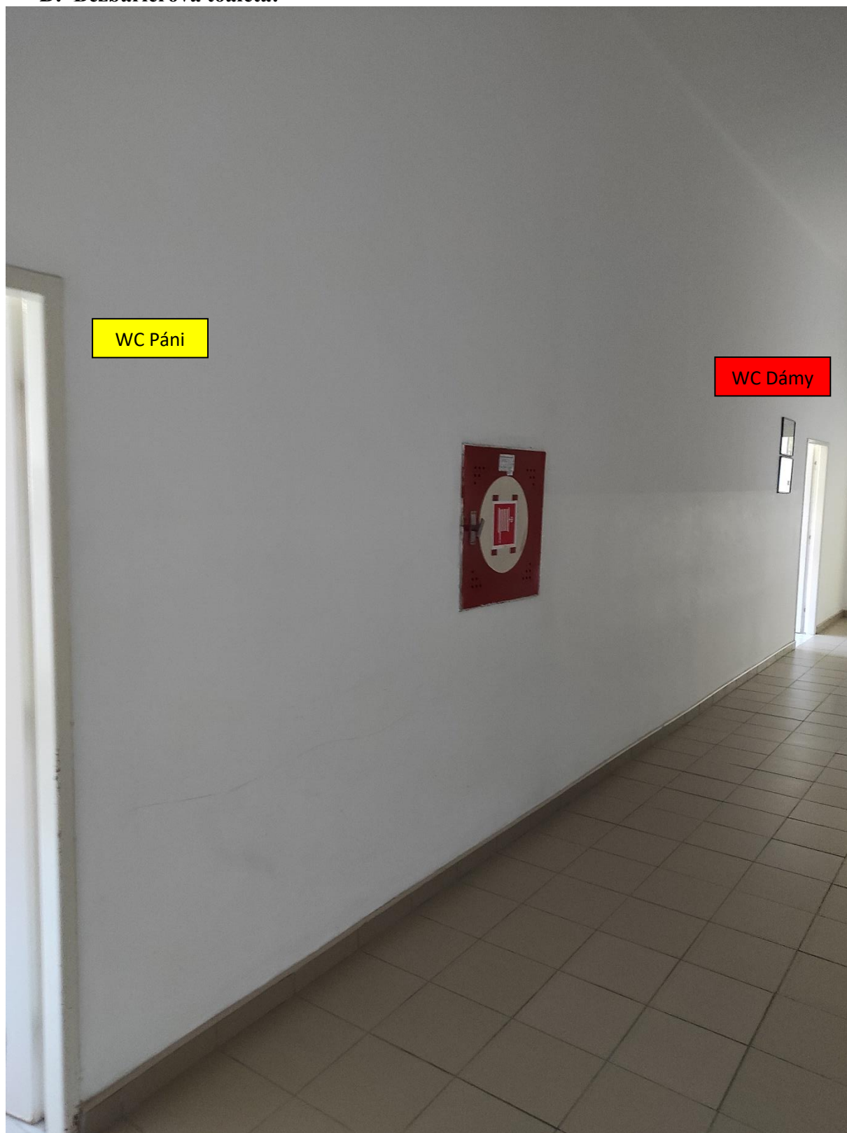
Navrhované miesto pre bezbariérovú toaletu