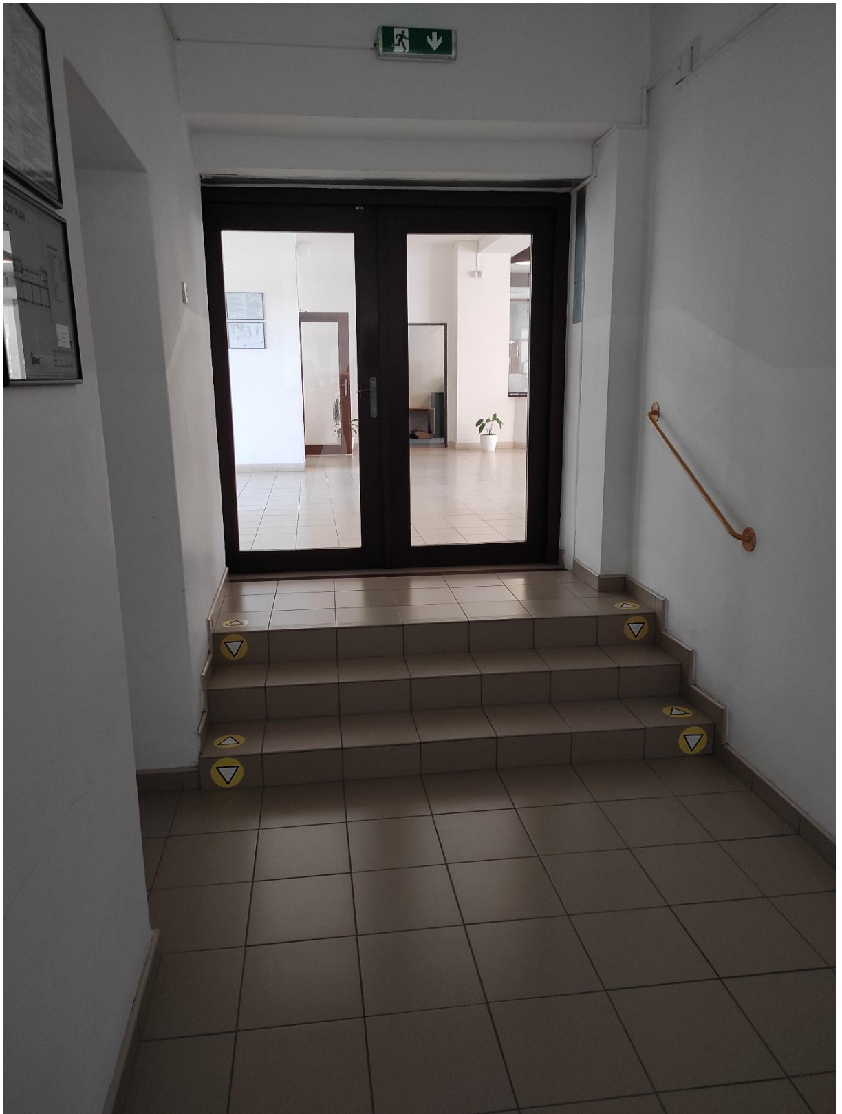
Trasa z vestibulu do chodby s učebňami, na ktorej sa nachádzajú v jej prvej časti 3 schody