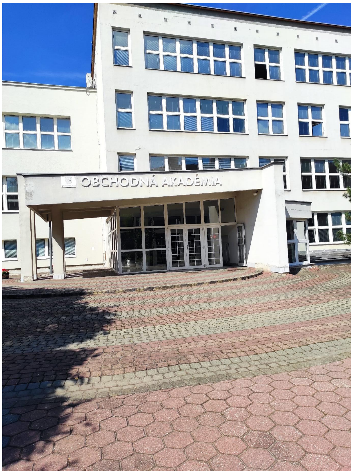
Vstup do budovy a bariéra pred ňou