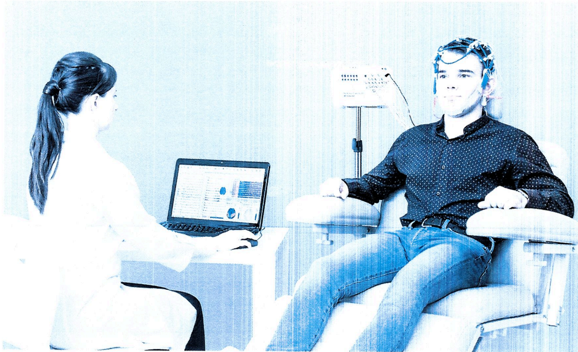
Obrázek 1.1 Přenosný variant EEG a notebookem

Softvér "Neuron-Spectrum.NET" pre natáčanie EEG, brainmapping a automatizované vytváranie reportu. Zahrnuté sú analytické nástroje ako spektrálna analýza, analýza koherencie, autokorelačná analýza, automatické vyhľadávanie spiků, ostrých vln a paroxymálnej aktivity a mnoho iných.