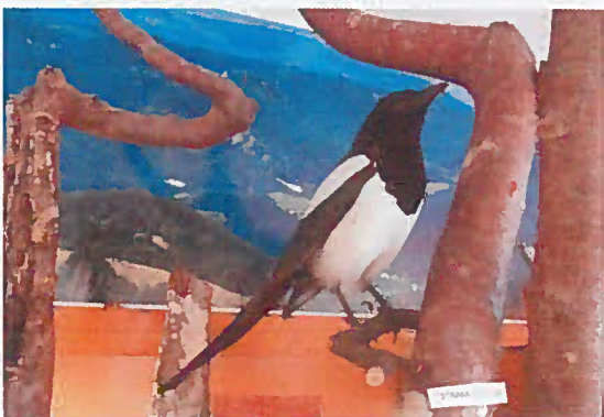
08. Z-03687 Straka obyčajná