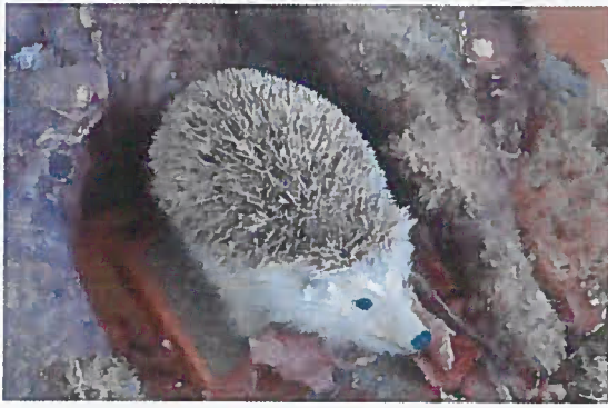
14. Z-10605 Jež bledý