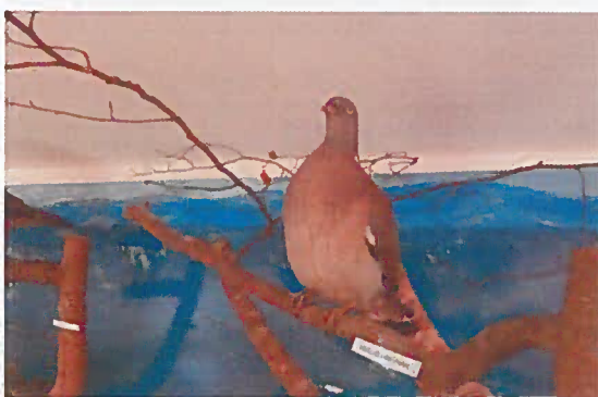
07. Z-03655 Holub hrivnák