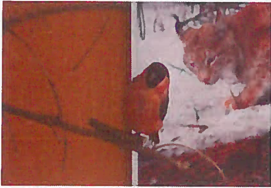
09. Z-03694 Hyl obyčajný