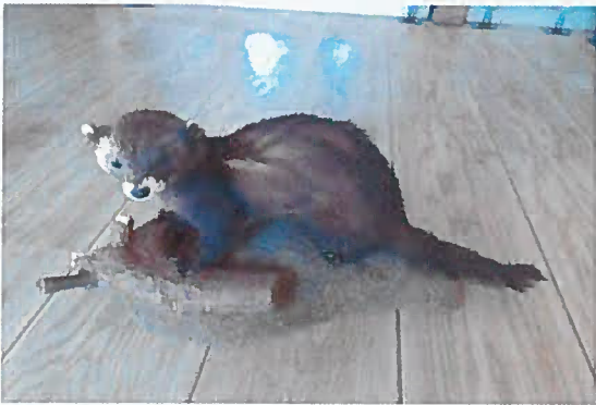
16. Z-15728-V Tchor tmavý