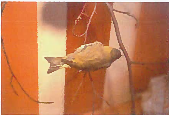
12. Z-06735 Stehlík čižik