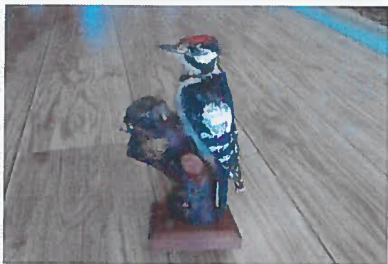
22. Z-15867-V Dáteř veľký