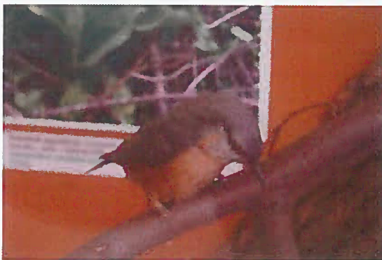
11. Z-05287 Brhlík obyčajný