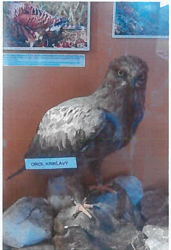
21. Z-15770-V Orol krikľavý