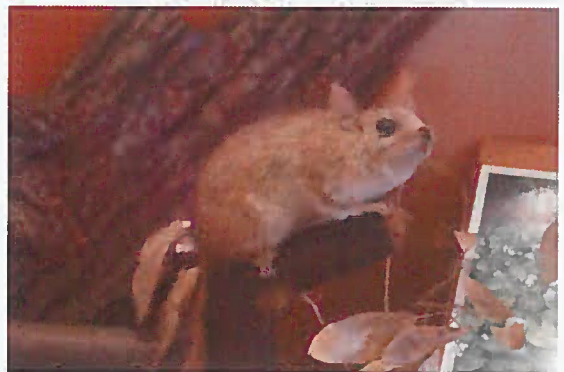
20. Z-15769-V Plch sivý