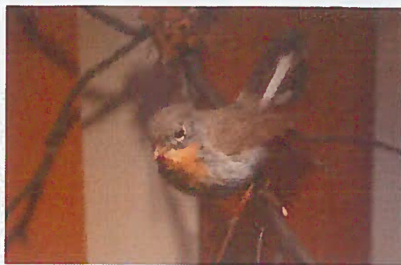
23. Z-18012-V Muhárik malý