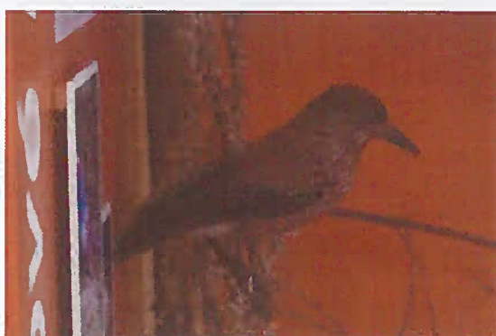
06. Z-00960 Orešnica perlavá