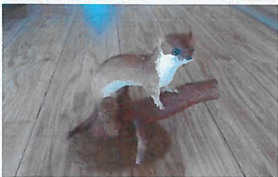
18. Z-15734-V Hranostaj čiernochvostý