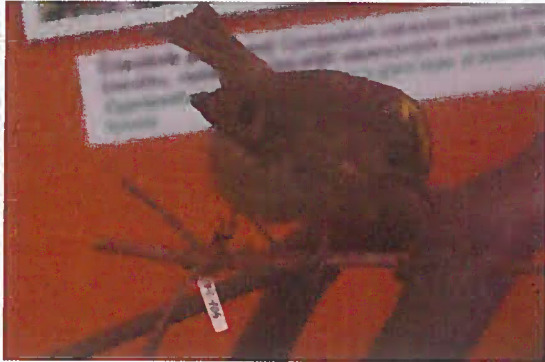
10. Z-03859 Králik zlatohlavý