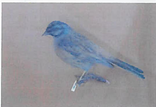
01. Z-00577 Strnádka cía