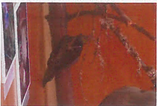
03. Z-00627 Ďubník trojprstý