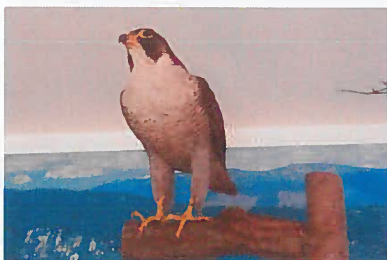
04. Z-00955 Sokol sťahovavý