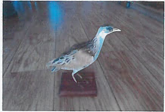
19. Z-15767-V Chrapkáč poľný