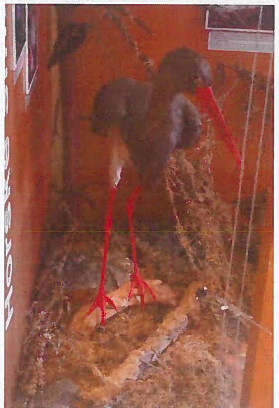
15. Z-11264 Bocian čierny