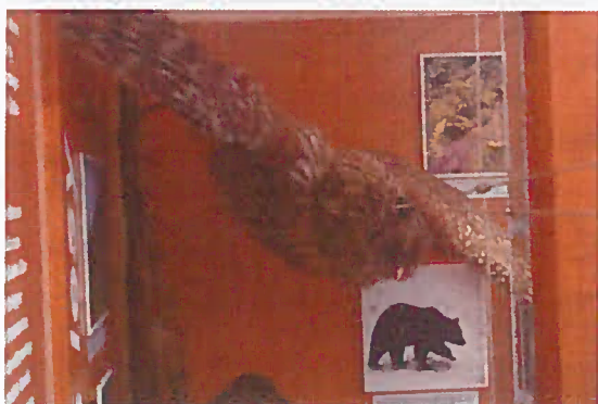
02. Z-00579 Sova dlhochvostá