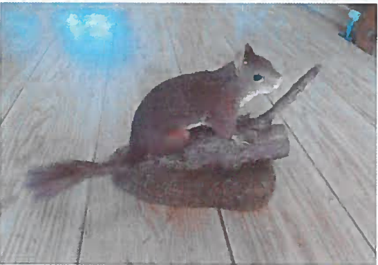
17. Z-15729-V Veverica obyčajná