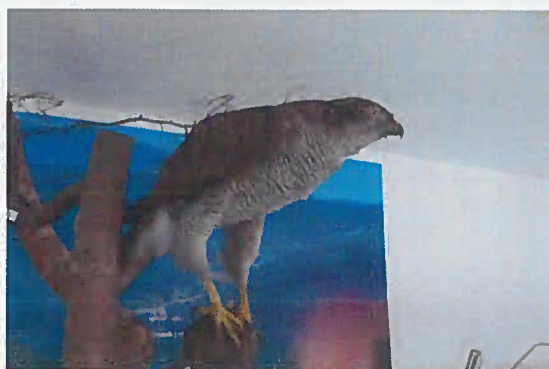
05. Z-00956 Jastrab veľký