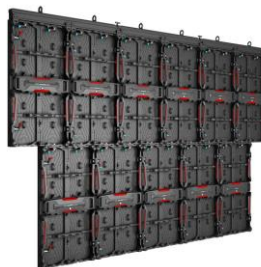
All in One modular design