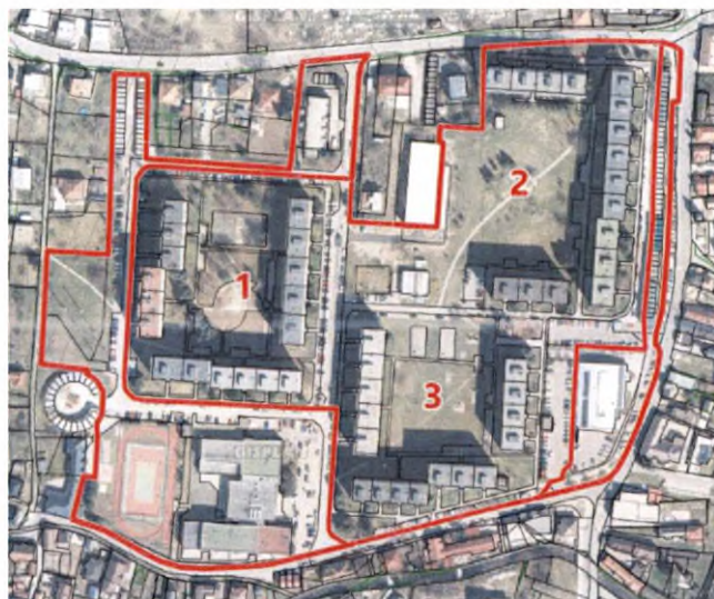
Obr. 3: Obrázok pre orientáciu v území

Nasledovné požiadavky boli zozbierané a prediskutované na participatívnych stretnutiach s verejnosťou.