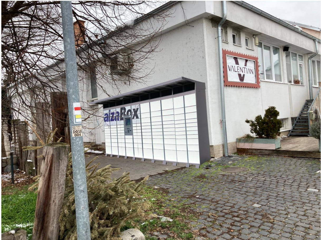
Príloha č. 2 - Špecifikácie označenia AlzaBoxu