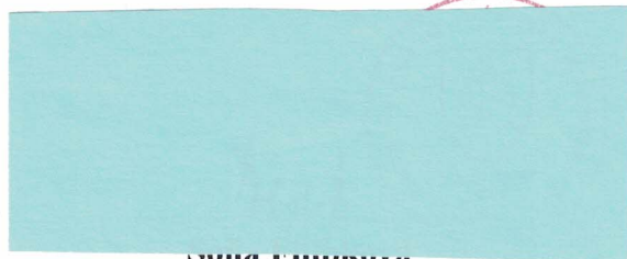
Sona Filipkova generálna tajomníčka služobného úradu