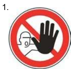
Nepovolaným vstup zakázaný (spolu so značkou č.2, 3 alebo 4 a príslušnou dodatkovou tabuľou)