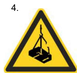
Nebezpečenstvo pádu alebo pohybu zaveseného bremena