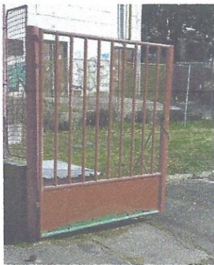
MŠ na Ul. A. Mišúta

Popis: Prevádzková brána v areáli škôlky.