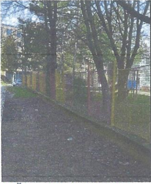
MŠ na Ul. A. Mišúta