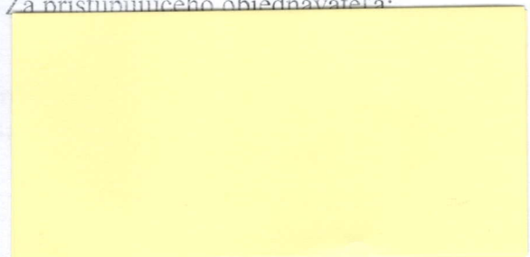
riaditeľ CDR Hriňová