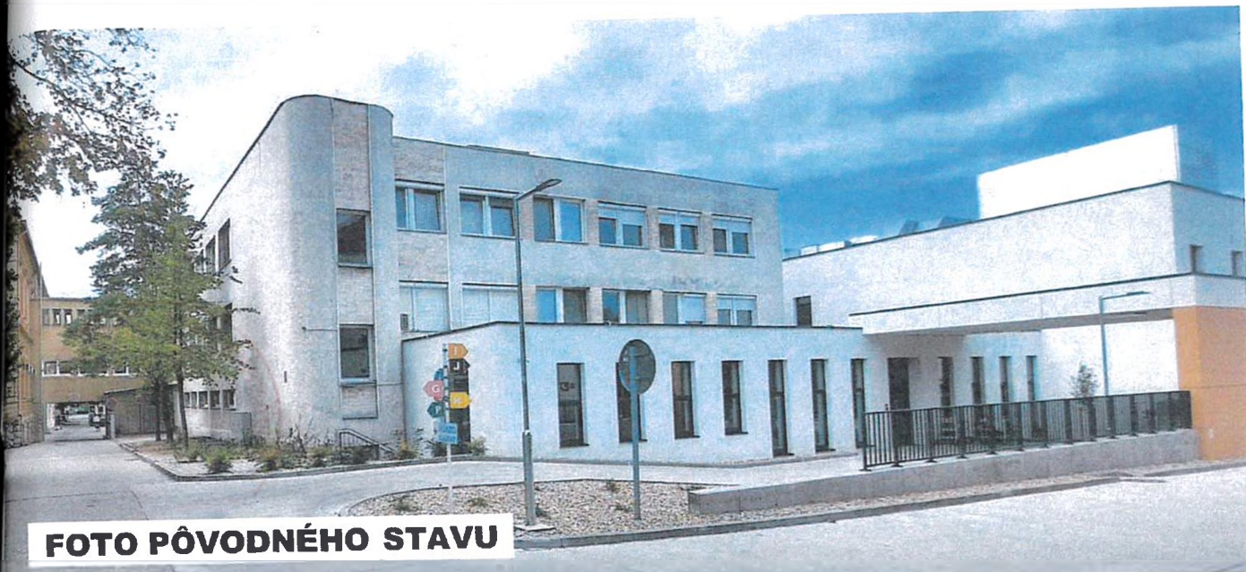
FOTO PÔVODNÉHO STAVU