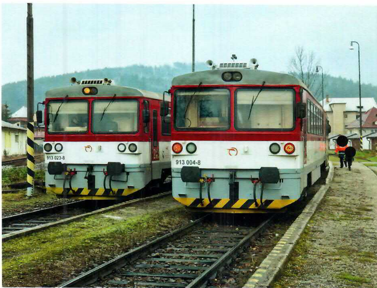
Foto: Železničná stanica Turzovka

Zdroj: Integrovaná doprava Žilinského kraja, s.r.o.