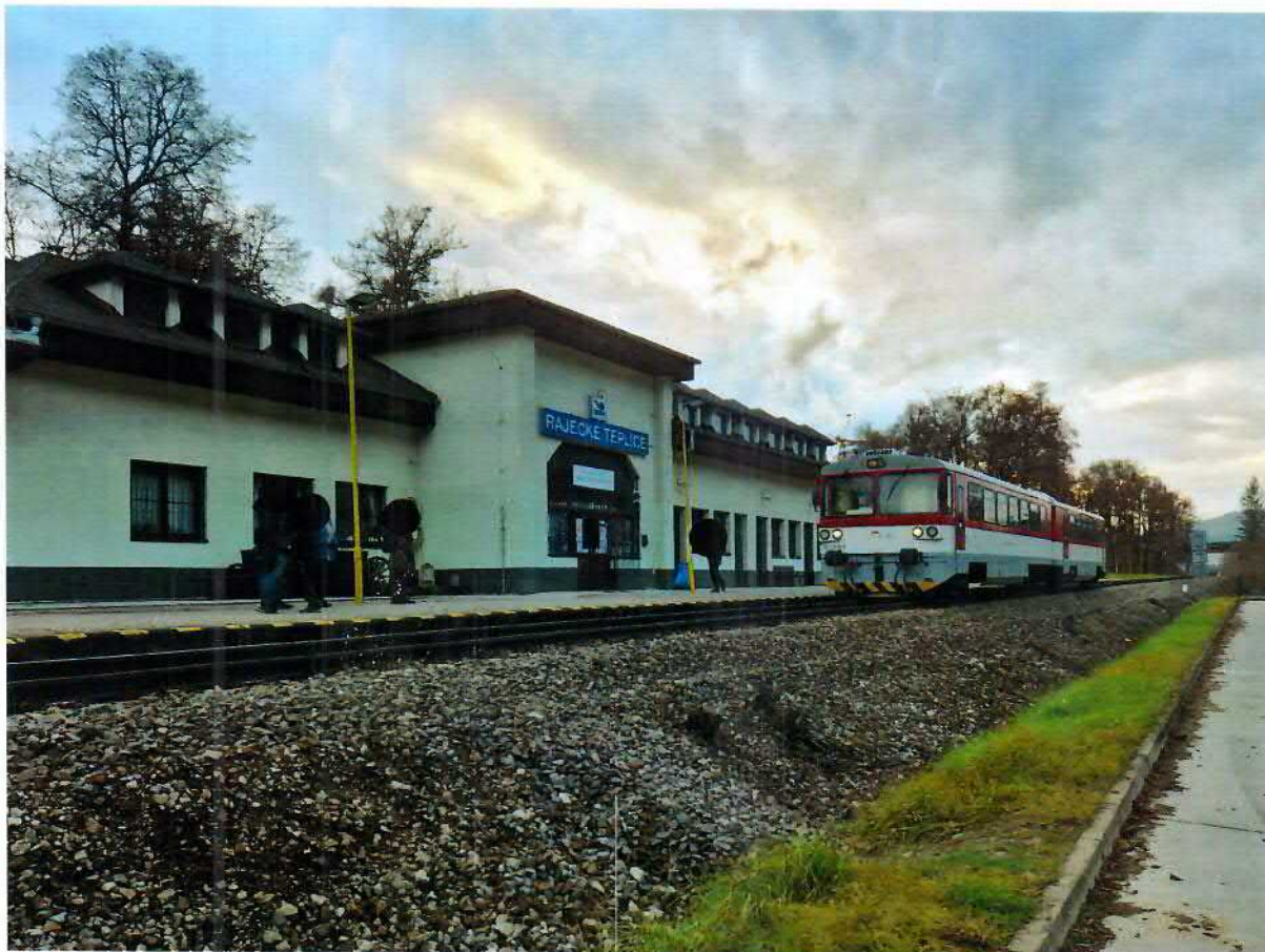
Foto: Železničná stanica Rajecké Teplice

Zdroj: Integrovaná doprava Žilinského kraja, s.r.o.