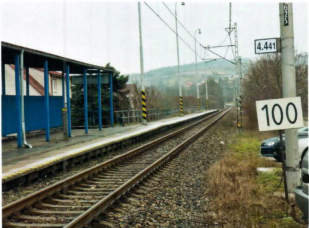
Foto: Jednokolajná elektrifikovaná železničná trať Čadca - Skalité rýchlosťou 100 km/h