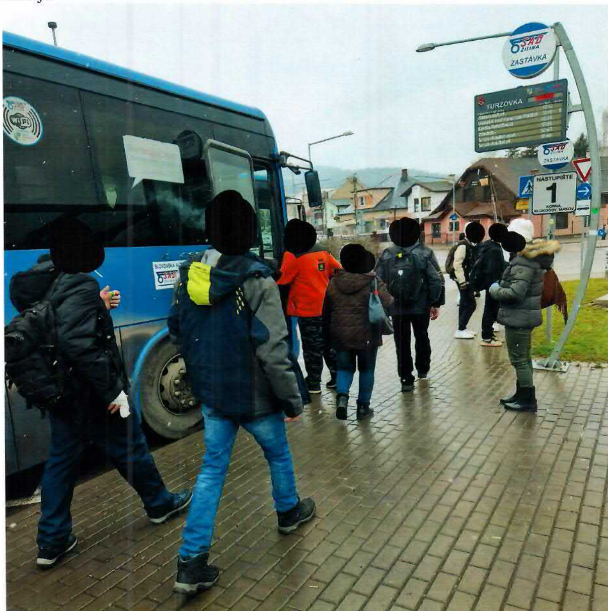
Foto: Moderný informačný systém na dopravnom terminále v Turzovke

Systémové strednodobé a dlhodobé plánovanie je obzvlášť dôležité pre prípravu projektov infraštruktúry, ktoré potom môžu pomôcť cielene riešiť miestne problémy počas realizácie, a najmä verejná doprava je v tomto ohľade nenahraditeľným prvkom ďalšieho udržateľného rozvoja.