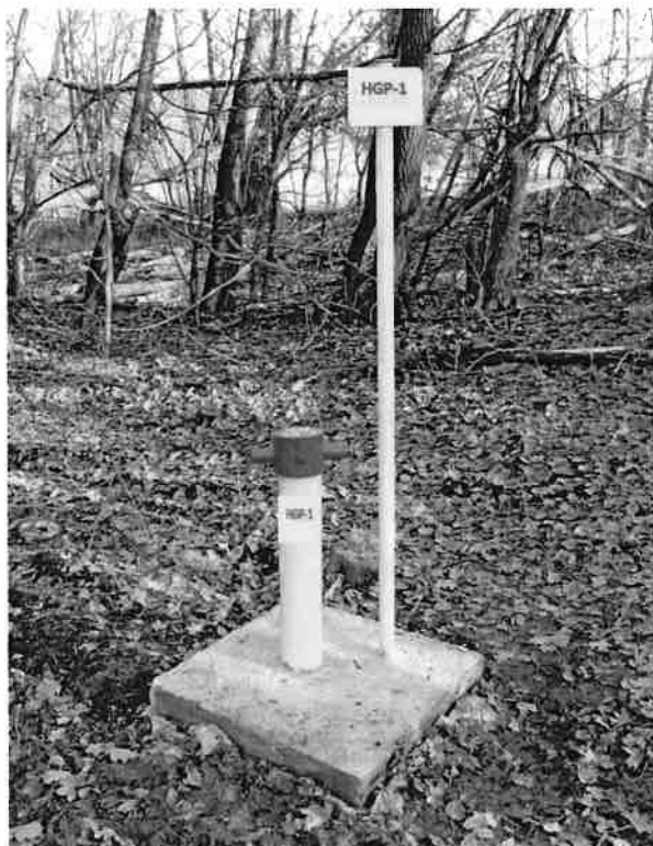
Tab. 1 Súradnice predpokladaných pozícií vrtných prác