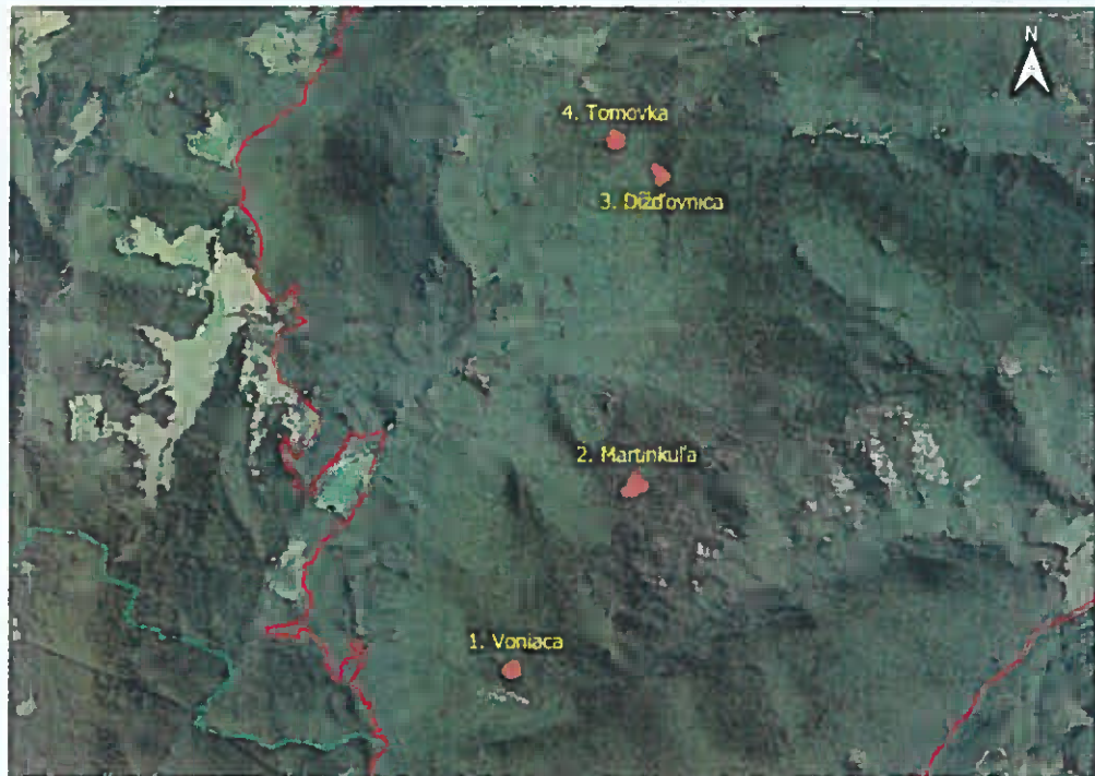
Voniaca (veľkosť plochy na výrub 1688,5 m 2 )