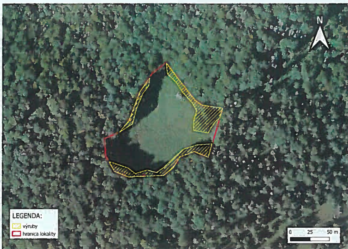
Dížd'ovnica (veľkosť plochy na výrub 1820 m 2 )